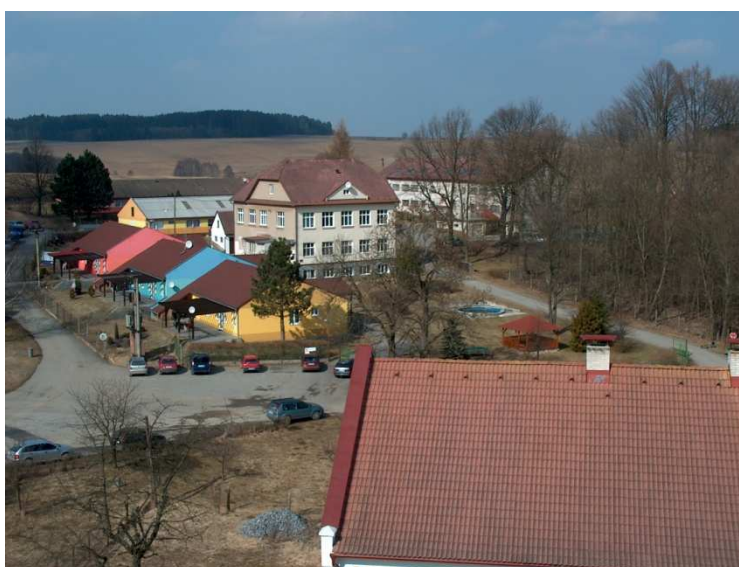
Domov pro osoby se zdravotním postižením Lidmaň