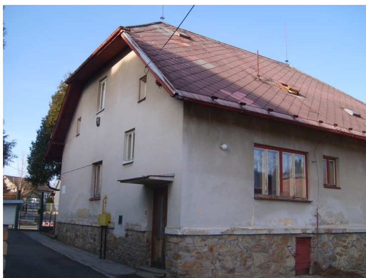
Chráněné bydlení Černovice